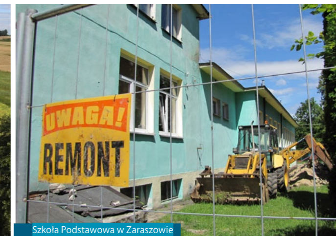
Szkoła Podstawowa w Zaraszowie