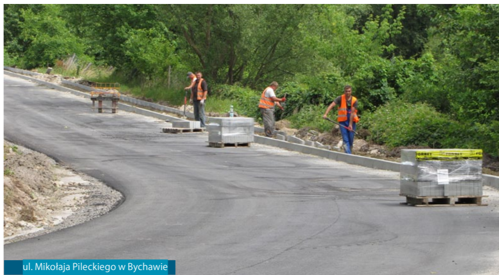
ul. Mikołaja Pileckiego w Bychawie