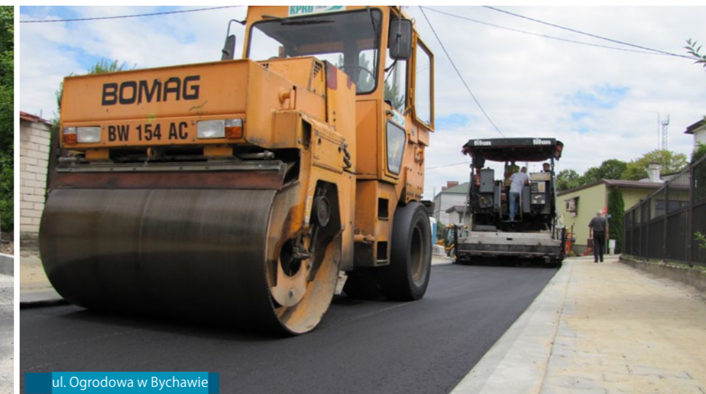
ul. Ogrodowa w Bychawie