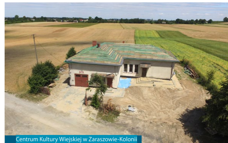
Centrum Kultury Wiejskiej w Zaraszowie-Kolonii

W ramach modernizacji Centrum Kultury Wiejskiej zrealizowane zostaną: wymiana pokrycia dachu,