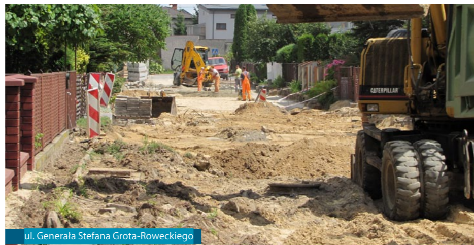
ul. Generała Stefana Grot-Roweckiego

Trwają prace budowlane przebudowy drogi między miejscowościami Leśniczówka i Łęczycza w ramach zadania utwardzania dna wąwozów lessowych.