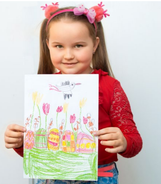
© Marek Matyszek / UM Bychawa