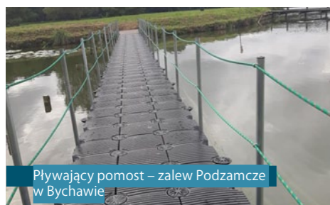
Pływający pomost – zalew Podzamcze w Bychawie