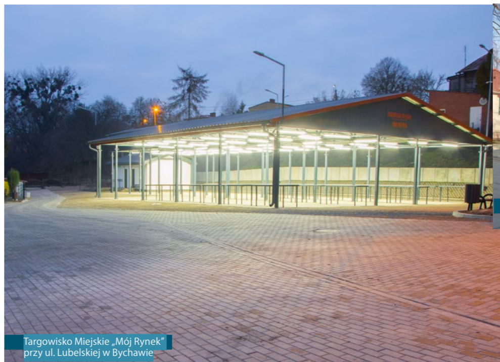
Targowisko Miejskie „Mój Rynek” przy ul. Lubelskiej w Bychawie

Przy wjeździe do Bychawy od strony Lublina odcieszy nowo wybudowane targowisko miejskie oraz parking. Realizacja tego ważnego przedsięwzięcia możliwa była dzięki uzyskanemu na ten cel