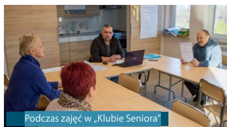
Podczas zajęć w „Klubie Seniora”

Zakończono modernizację wjazdu oraz placu manewrowo-postojowego przy Szkole Podstawowej im. Zofii Przewłockiej w Woli Gałęzowskiej. Ułożone zostało 474 m 2 kostki brukowej. Wartość zadania, które zostało zrealizowane ze środków budżetu Gminy Bychawa, to: 74 364,56 zł.