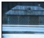
zbiorczo na str. 4

W szkole ratunkowej spowodowanej powodzią udział brały jednostki OSP z Olszowca, Bychawki I, Bychawki II, Starej Wsi, Gałęzowca, Kotłowa, Zarzawca. Największe pokopania miały miejsce w Starej Wsi I, Gałęzowcu (tam też wywieszono do ewakuacji szkoły woda strazy powodzi i Lęborka, Zamość. Pomoc strażaków polegała głównie na wypompowywaniu wody z piwnic i bud-