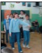
Wzrost w wyjazdach polskich uczniów, a którzy nie będąc łatwo znaleźć wspólny język do komunikacji.