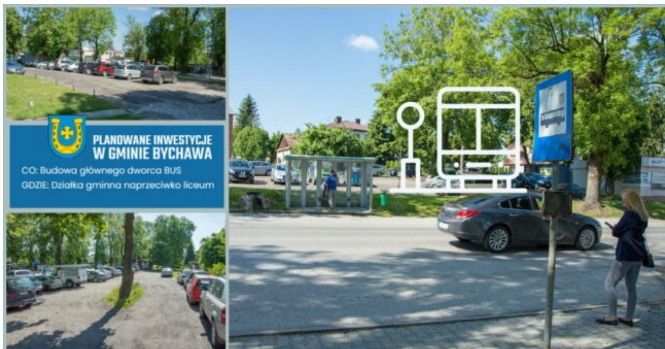
Planowana budowa dworca