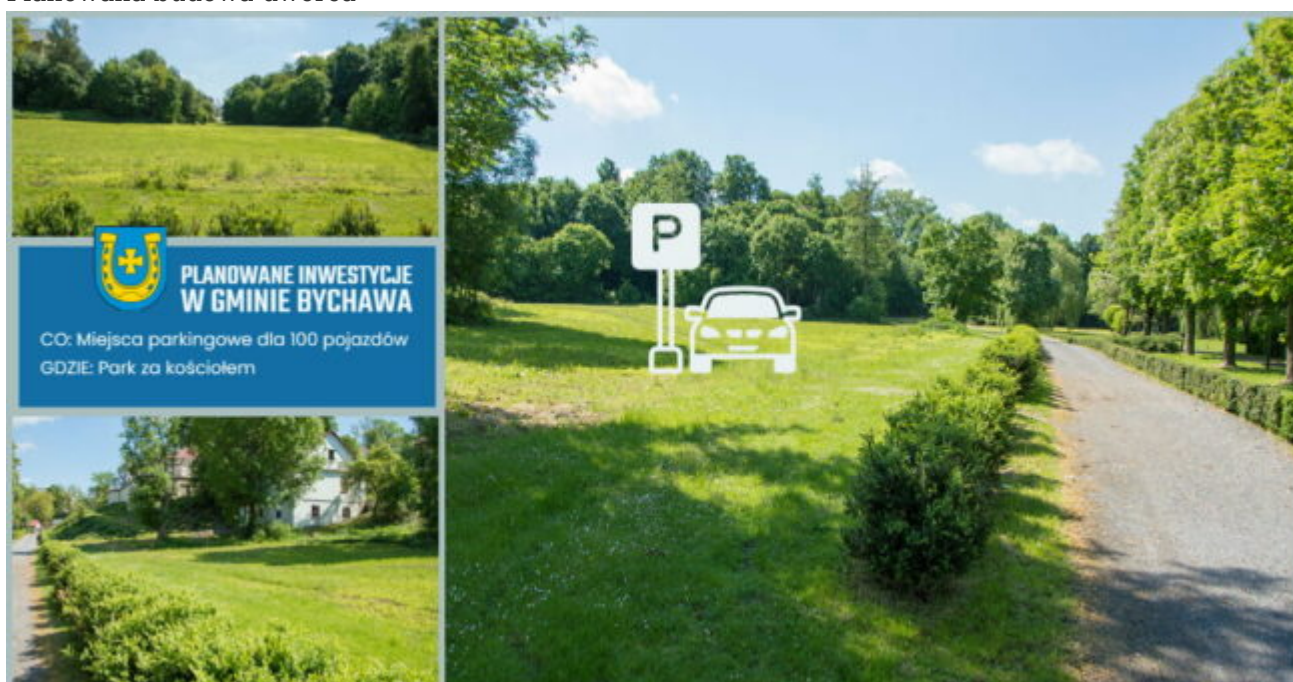
Planowane miejsca parkingowe

Dzięki pomocy finansowej przekazanej przez Gminę Bychawa Powiatowi Lubelskiemu zrealizowany ma zostać III etap zadania „Przebudowa drogi powiatowej nr 2278L Osmolice-Bychawka-Bychawa w miejscowości Bychawka Pierwsza i Bychawka Druga w zakresie wykonania chodnika”.