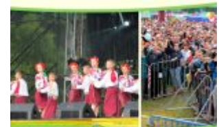
Wydarzenie kulturalne na stadionie miejskim