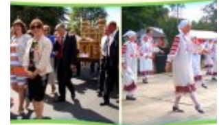
Występy Gminne w miejscowości Bychawa