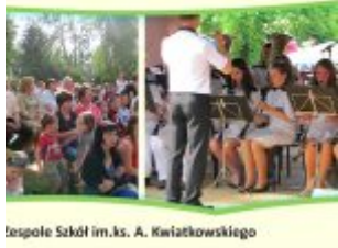
Występ Orkiestr Dętych w Zespole Szkół im. ks. A. Kwiatkowskiego