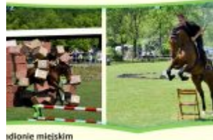
Wzrost z Wszechstronnego Wychowania Koni i Kuców w Stadionie Miejskim