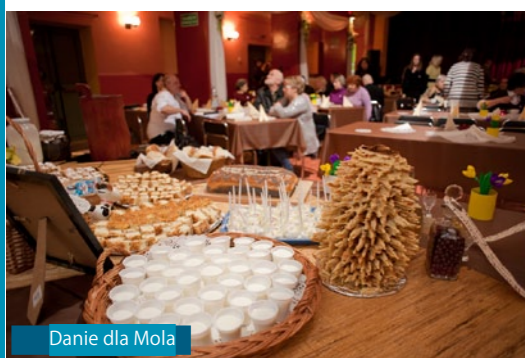
Danie dla Mola