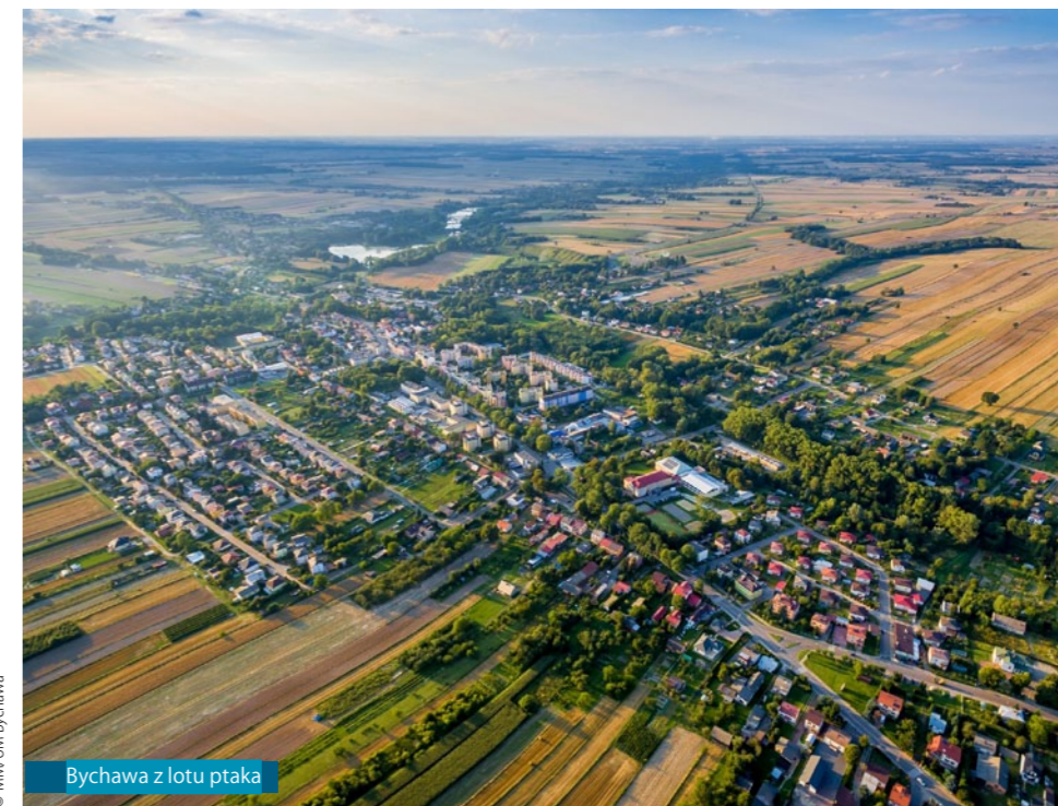
Bychawa z lotu ptaka

Cyklista, po dniu spędzonym na rowerze, może w Bychawie zasmakować w przepysznych pierogach. Najlepszą okazją do poeksperymentowania z nowymi smakami jest Ogólnopolski Festiwal „W Krainie Pierogów”. Odbывается on w ostatni weekend maja. Od 2016 roku połączony jest z Festiwalem Produktów Regionalnych i Tradycyjnych „Na kulinarnym szlaku wschodniej Polski”, którego głównym celem jest promocja wysokiej jakości żywności, wytwarzanej przez lokalnych wytwórców w oparciu o tradycyjne technologie z wykorzystaniem regionalnych i naturalnych surowców.