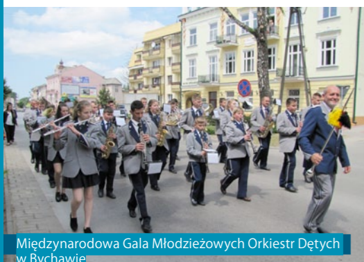
Międzynarodowa Gala Młodzieżowych Orkiestr Dętych w Bychawie