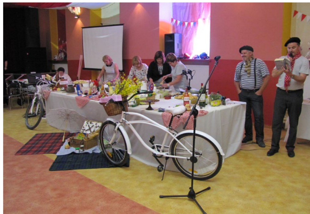
do tańca porwała nas sama prezes Bychawskiego Stowarzyszenia Współpracy Międzynarodowej