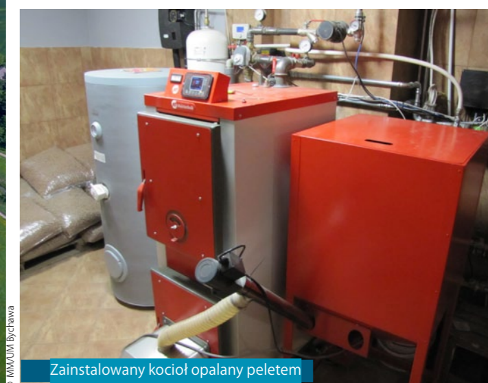
Zainstalowany kocioł opalany peletem