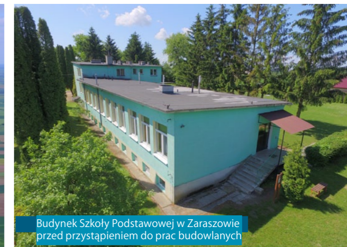
Budynek Szkoły Podstawowej w Zaraszowie przed przystąpieniem do prac budowlanych