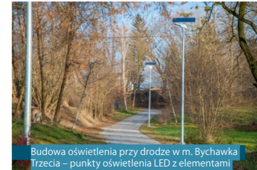
Budowa oświetlenia przy drodze w m. Bychawka Trzecia – punkty oświetlenia LED z elementami instalacji fotowoltaicznej