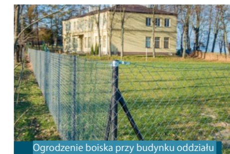
Ogrodzenie boiska przy budynku oddziału przedszkolnego w m. Osowa