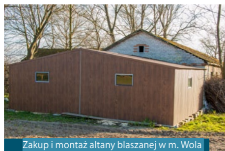
Zakup i montaż altany blaszanej w m. Wola Duża-Kolonia