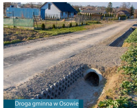
Droga gminna w Osowie