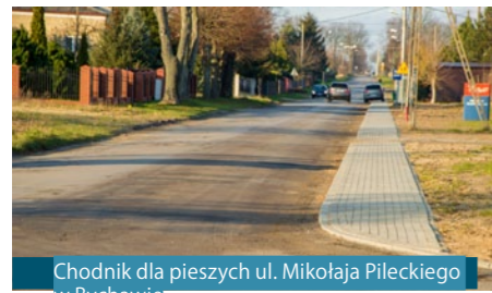
Chodnik dla pieszych ul. Mikołaja Pileckiego w Bychawie