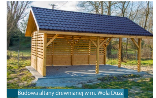
Budowa altany drewnianej w m. Wola Duża