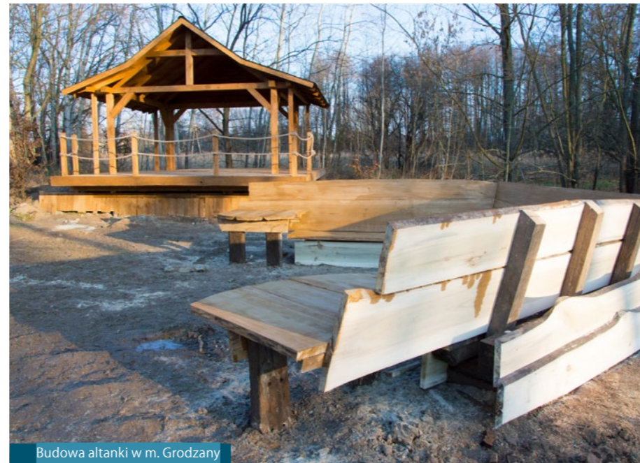
Budowa altanki w m. Grodzany

Wśród zrealizowanych inwestycji znalazły się między innymi: remonty dróg gminnych, zakup kruszywa i tłucznia; budowa oświetlenia LED zasilanego solarnie; budowa wiat przystankowych; remonty i zakup wyposażenia świetlic wiejskich oraz innych budynków użyteczności publicznej, budowa altan; przedsięwzięcia związane z OSP; dokumentacje projektowe oraz wiele innych działań.