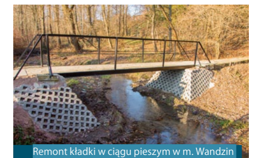
Remont kładki w ciągu pieszym w m. Wandzin (okolica ogródków działkowych)