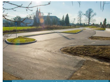
Miejsca postojowe i chodnik dla pieszych przy cmentarzu parafialnym w Bychawce Drugiej

■ Przebudowę chodnika dla pieszych w pasie drogi powiatowej przy ul. Mikołaja Pileckiego w Bychawie o długości około 300 mb. Wkład Gminy Bychawa: 66 800,00 zł.