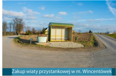
Zakup wiaty przystankowej w m. Wincentówek