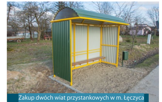
Zakup dwóch wiat przystankowych w m. Łęczycza