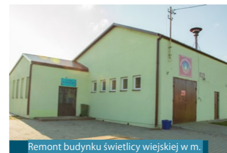
Remont budynku świetlicy wiejskiej w m. Gałęzów-Kolonia Druga