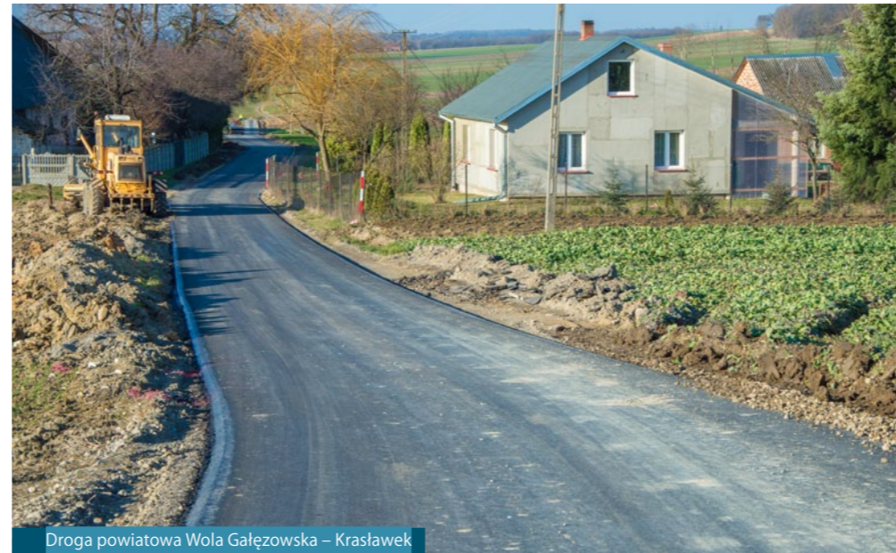
Droga powiatowa Wola Gałęzowska – Krasławek

■ Budowę spinki wodociągu Bychawa – Wola Duża-Kolonia o długości 955 mb. Wartość zadania: 350 000,00 zł. Przedsięwzięcie realizowane było w ramach środków własnych Gminy Bychawa. Wykonawca – Bychawskie Przedsiębiorstwo Komunalne Bychawa.