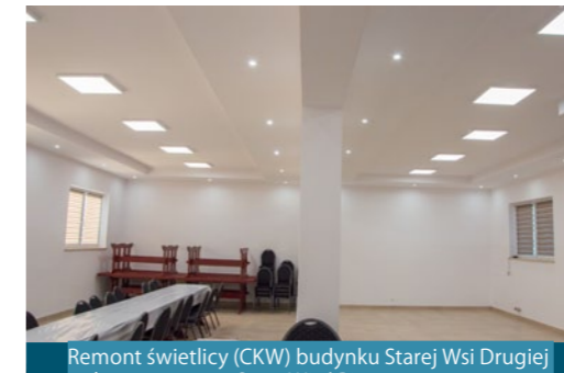
Remont świetlicy (CKW) budynku Starej Wsi Drugiej położonego w m. Stara Wieś Pierwsza