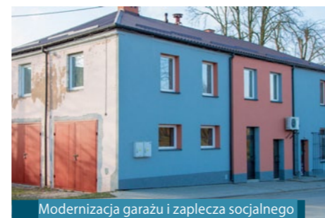
Modernizacja garażu i zaplecza socjalnego w budynku OSP w m. Olszowiec