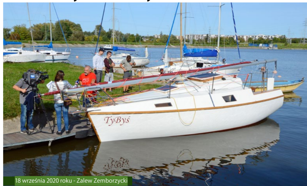
18 września 2020 roku - Zalew Zemborzycy

Główną cechą wyróżniającą Sztrandka 750 z całej masy jachtów jest to, że został zaprojektowany i zbudowany w technologii „oblaminowanej słomki” (cienkie listewki drewniane pokryte warstwą maty szklanej przesączonej żywicą). Sztrandek 750 jest słupem bermudzki (najpopularniejszy rodzaj