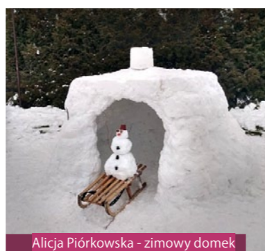
Alicja Piórkowska - zimowy domek

Spragnieni aktywności na świeżym powietrzu uczniowie nadesłali ponad 40 zdjęć prac. Wszyscy włożyli w swoje dzieła dużo pracy. Wybranie tych najlepszych było bardzo trudnym zadaniem, ponieważ pomysłowość młodzieży jest niesamowita. Dlatego jury postanowiło nie wyłaniać zwycięzcy, a wyróżnić 9 figur.