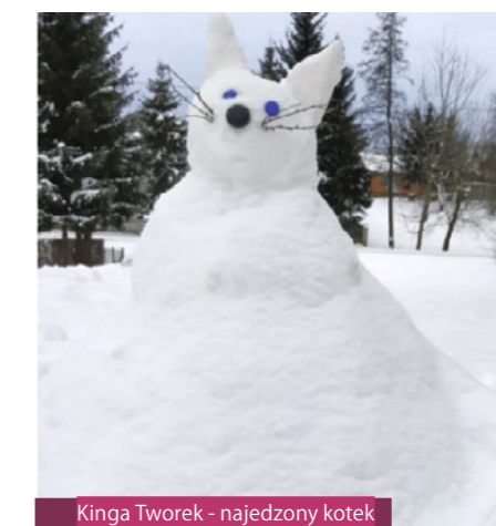
Kinga Tworek - najedzony kotek