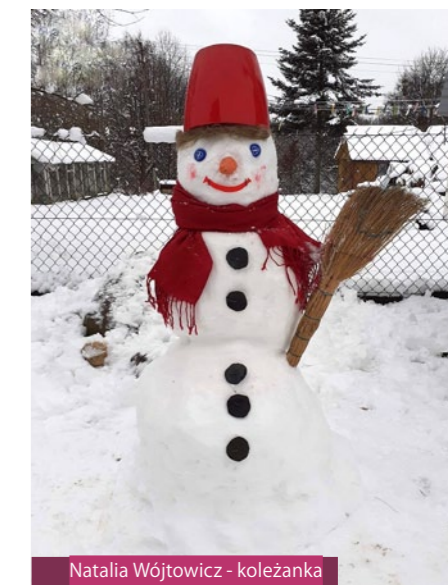
Natalia Wójtowicz - koleżanka