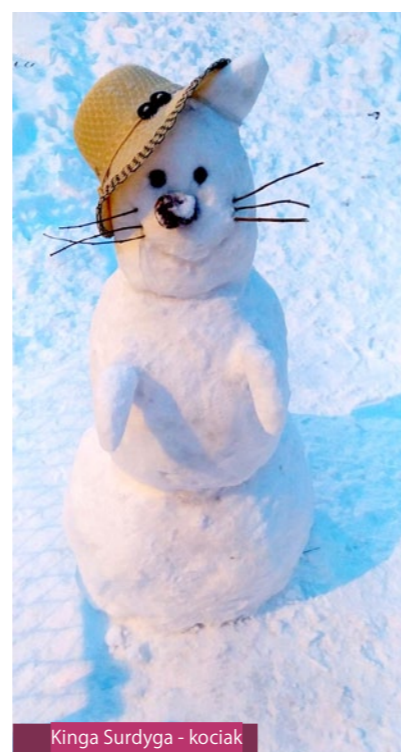
Kinga Surdyga - kociak